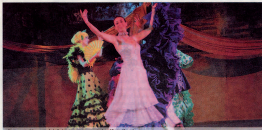
Un momento del espectáculo La Cenicienta, que se representará en el Teatro Alameda.

Málagaactiva | Del 16 al 31 de mayo de 2008