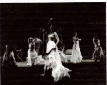
Un grupo de bailarinas durante una de las escenas del espectáculo.